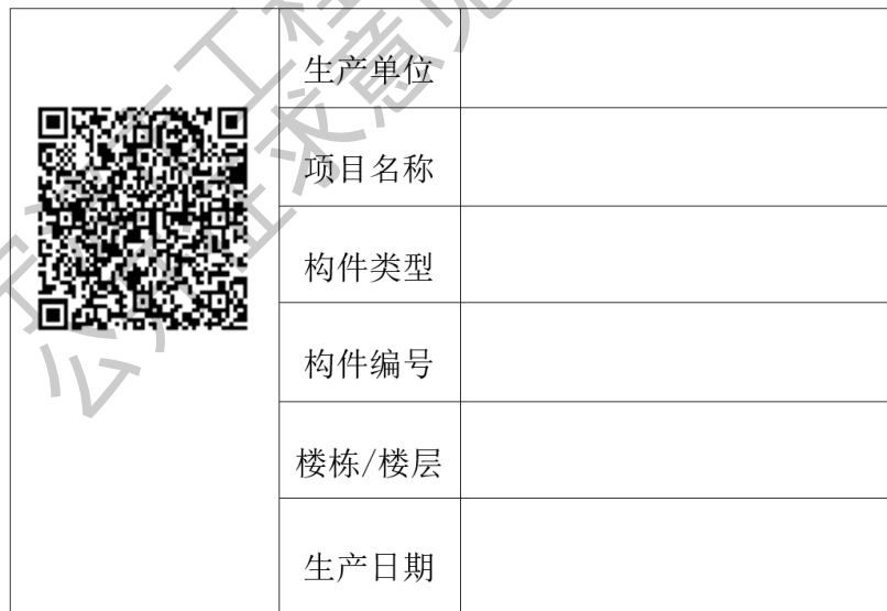
图 6.3.4 构件标识样例

6.3.4 每一个构件应有标识。标识的内容包括且不限于构件生产单位、项目名称、构件类型、构件编号、楼栋楼层、生产日期及用于信息化管理的二维码。标识格式可参照图 6.3.4 所示。